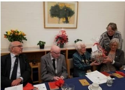
Billede collagen er fotograferet og lavet af Annelise Debois