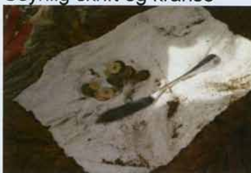
Skatte fundet på kirkegården! www.3vejle.dk