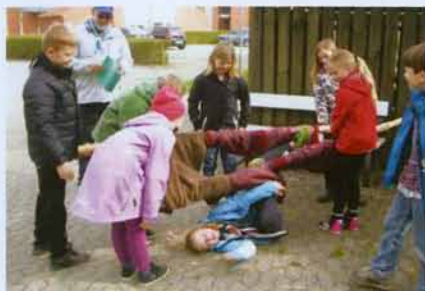
Førstehjælp – en ommer