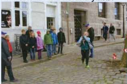
Ringridning Flere billeder kan ses på