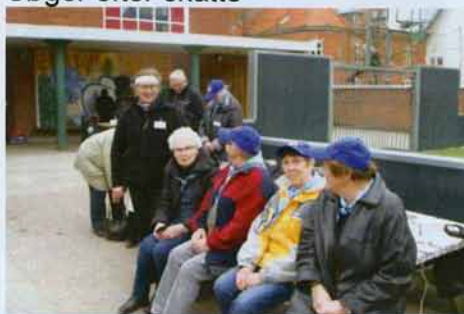
Gildebrødre slapper af efter løbet