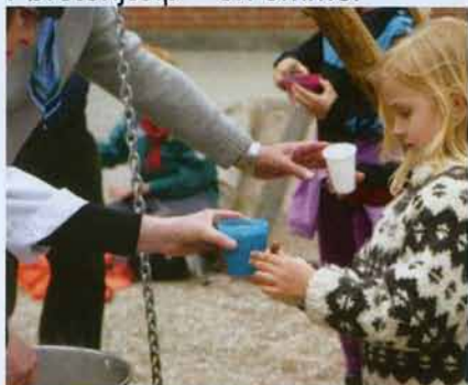
Suppen smagte rigtig godt