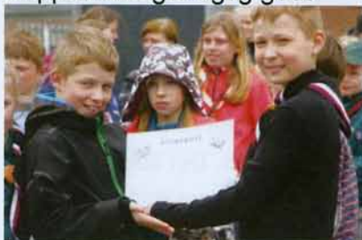
Præmien – en tur til Dybbøl