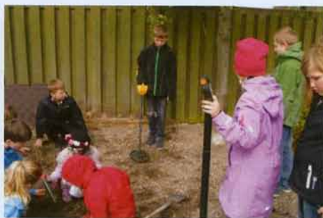
Søger efter skatte