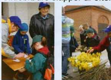
Usynlig skrift og kranse