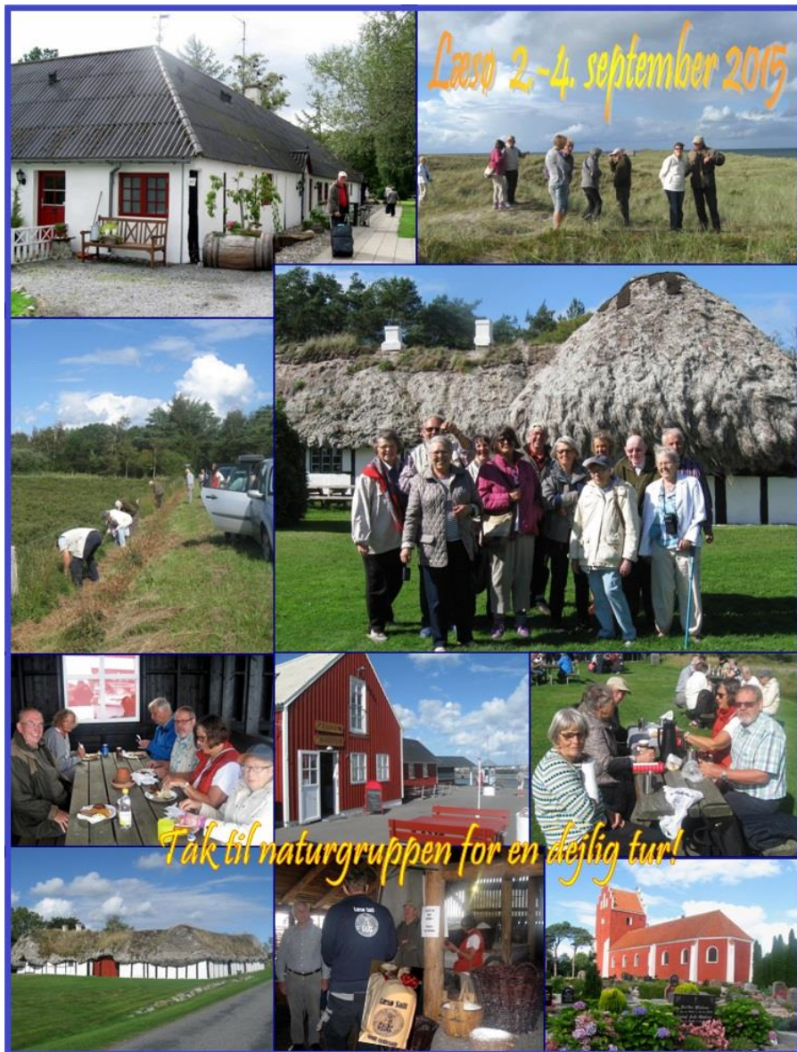
Naturgruppen på den årlige ekspedition til steder hvor det er herligt at gå på opdagelse i den særlig spændende natur