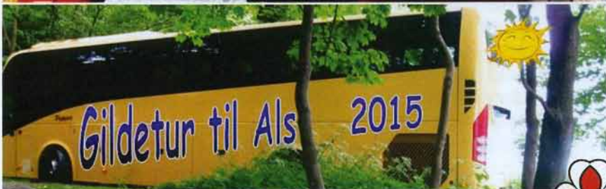
Annelise Debois, 2. Vejle