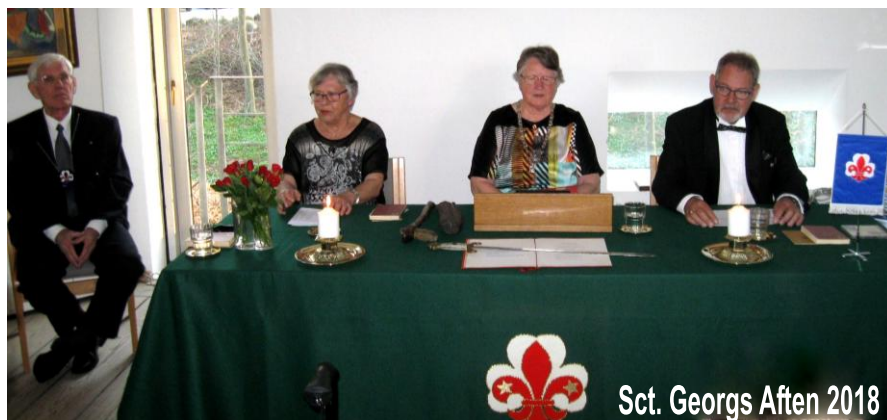
Sct. Georgs Aften 2018