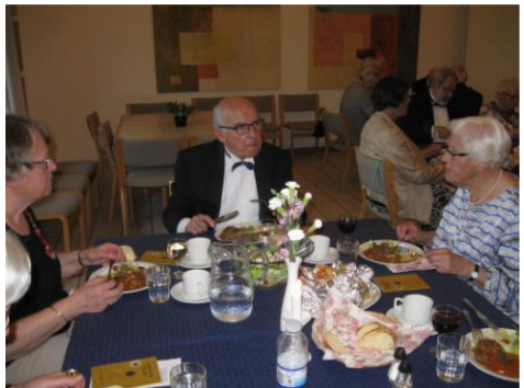
Jubilæumsgildehal hvor 50 året fejres i 2. Vejle